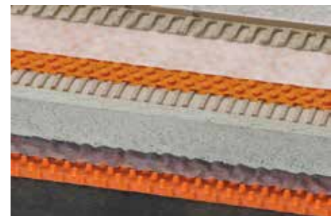
Schlüter-TROBA-PLUS 8 (12)